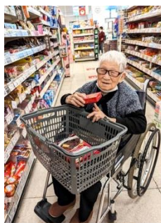
大好評！お買い物イベント

毎年お盆明けに行う納涼祭やクリスマスイベント、餅つき大会ほか、趣向を凝らした季節のイベントも、内郷デイサービスの特徴です。